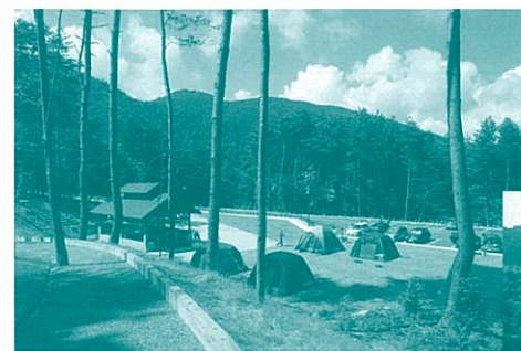
■恐羅漢キャンプ場