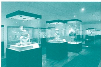
ウッドワン美術館